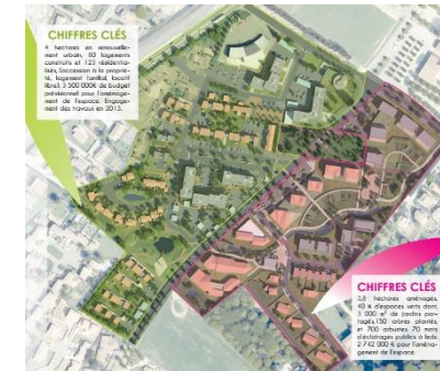
Aménagement Ecoquartier - Loriol