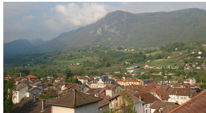
Saint Jean en Royans - PVD