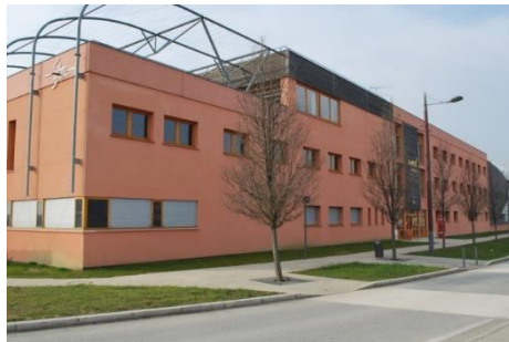
Bureaux CCI - Alixan