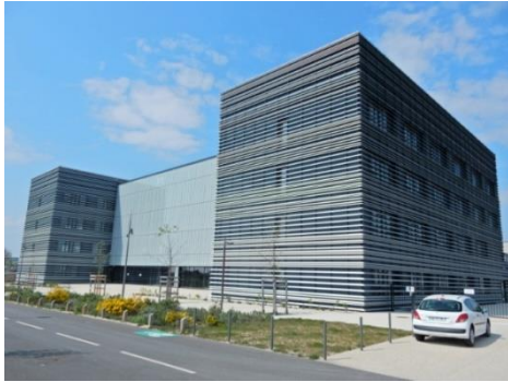
Pôle de recherche Ecotoxicologie - Valence