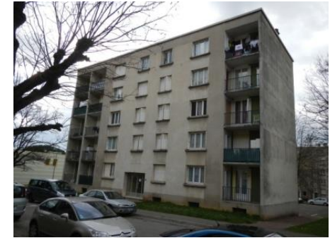
ORCOD - Saint Vallier