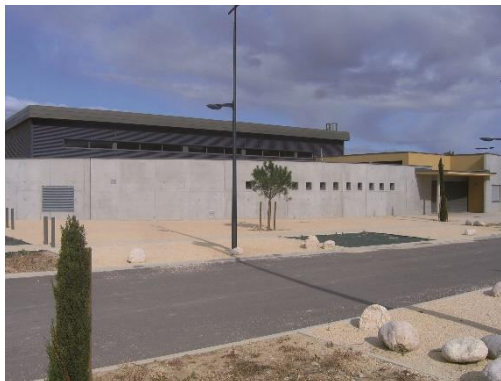
St Jean en Royans MO Mandaté