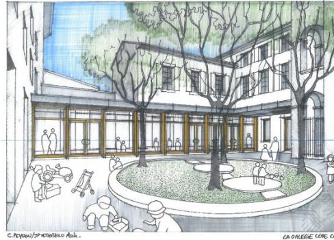
Multi Accueil - Die