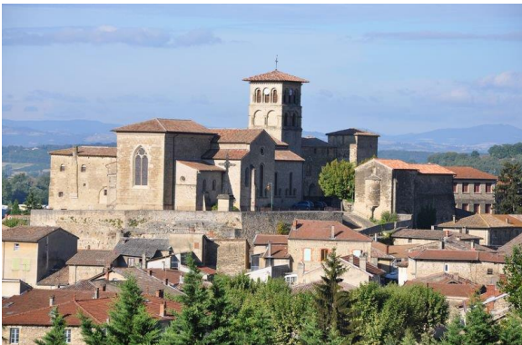
Saint Donat sur l'Herbasse - PVD