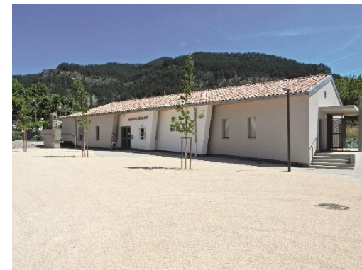
Luc en diois MO en propre