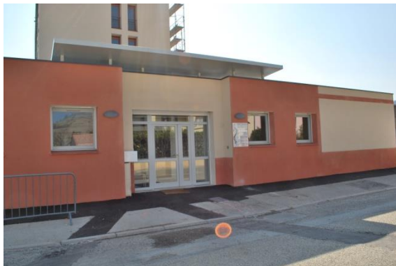
Tain l'Hermitage VEFA inversée

Ex. lutte contre la désertification médicale : les maisons médicales